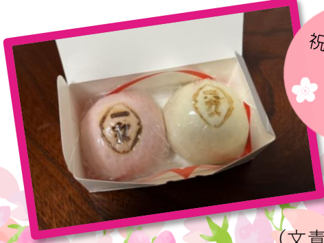
祝い菓子 舟和の 紅白饅頭