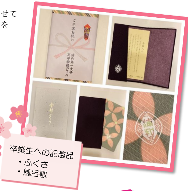
卒業生への記念品 ・ふくさ ・風呂敷