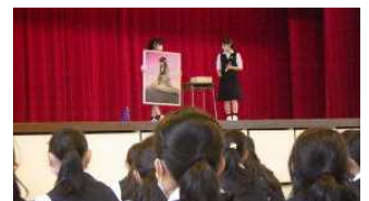
部活動説明会（バレーボール部・美術部）