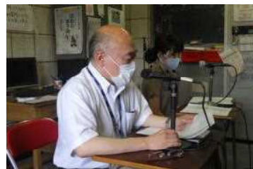
全校集会（校長先生のお話）

本校は前後二期制のため終業式ではありませんが、7月31日（金）に放送による全校集会を行い、各教室で通知表が手渡されました。何事も異例づくめの半年でしたが、様々な活動に打ち込める夏休みを迎えます。