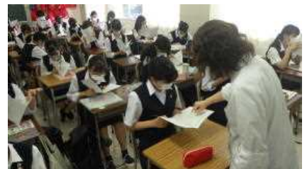
1年生は初めての通知表です