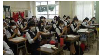
生徒総会（拍手による承認）