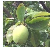
アジサイと 花梨の実