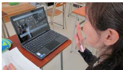
オンラインによるホームルーム