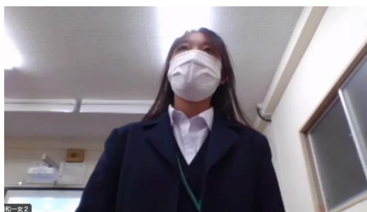
ディベート実践の様子

最後に、高校時代から即興型英語ディベートを続けているジャッジスタッフから、ディベートを通じた学びについてメッセージが伝えられ、体験会が終了しました。