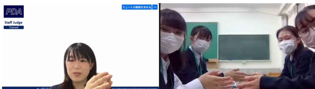
ディベート後のエアークラップ