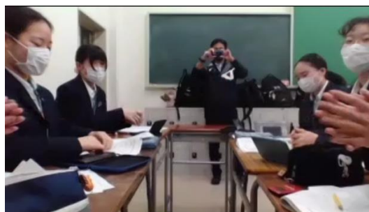
ディベート後のエアークラップ